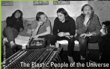
The Plastic People of the Universe