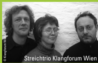
Streichtrio Klangforum Wien