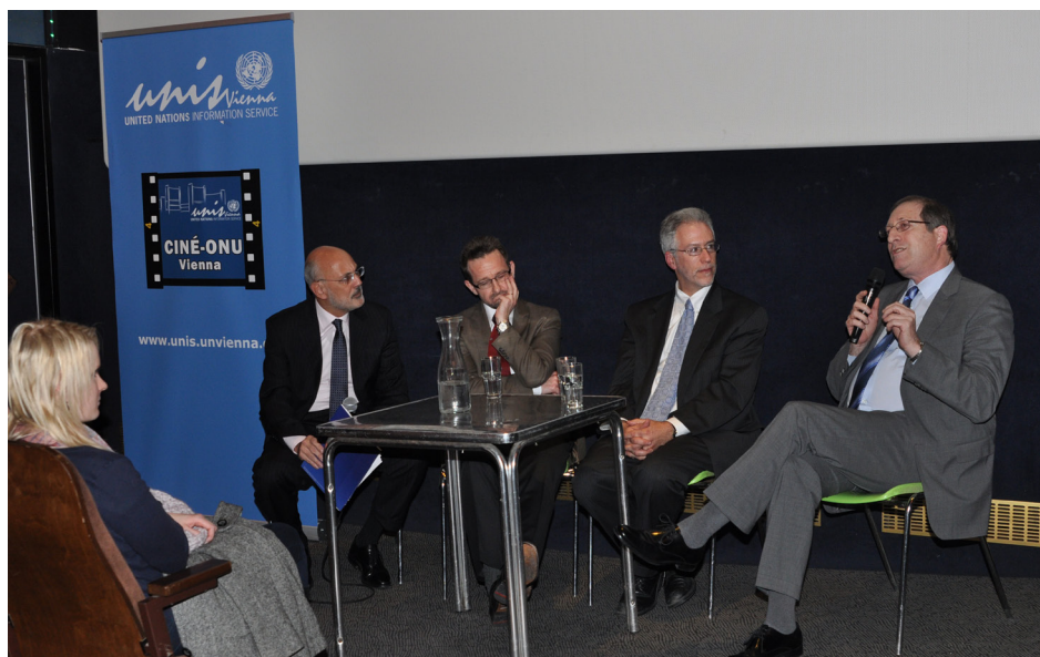
H.E. Aviv Aharon Shir-On, Ambassador of Israel (at right) as guest speaker

The subsequent discussion circled around the expectations for the upcoming Rio+20 summit and the legal issues behind the enforcement of international environmental legislation.