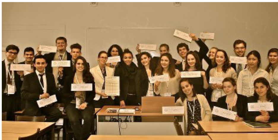
The NATO Committee at PIMUN 2012

The next MUN, which I participated in, was DanMUN, where I was faced with a completely