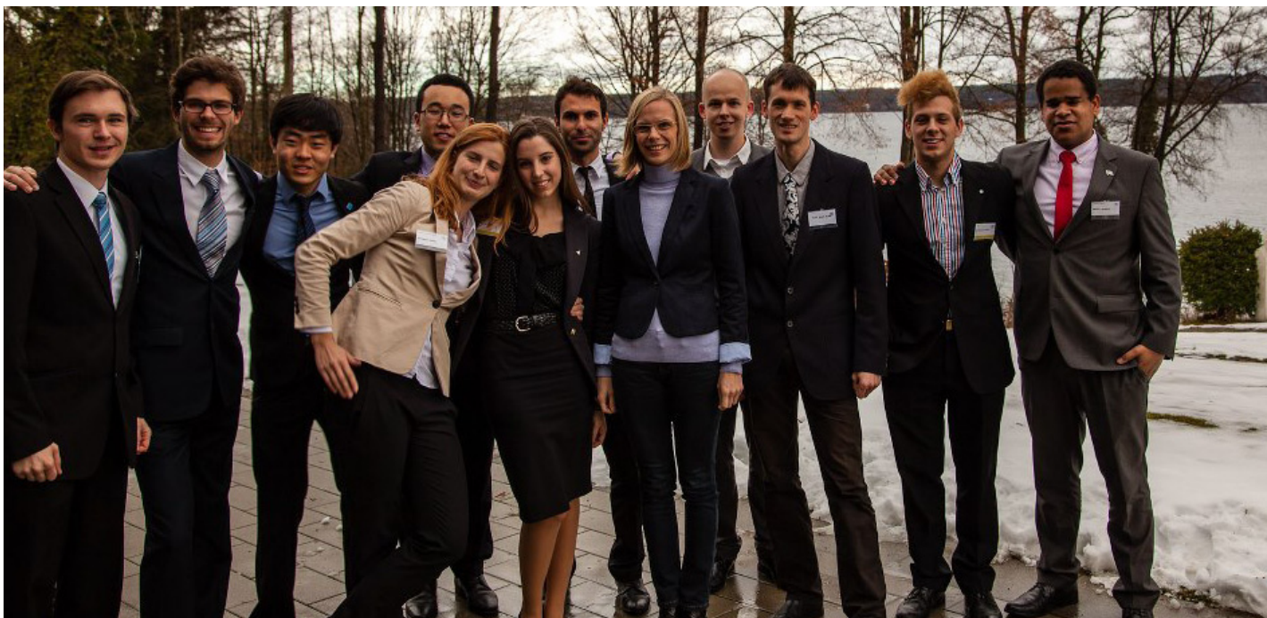
At IsarMUN 2012