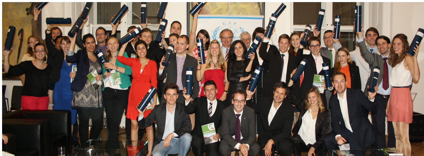
Verleihung der GAP-Diplome des Jahrgangs 2012. Falls auch du dabei sein willst, findest du alle Infos unter http://afa.at/gap

Wem mein Bericht jetzt zu allgemein gehalten war, kann sich gerne selbst ein Bild machen und sich für eine Gasthörer/innen/schaft des heurigen Jahrgangs bewerben. Für alle anderen kann ich zum Abschluss unterstreichend sagen: „Geil war’s!“ <<