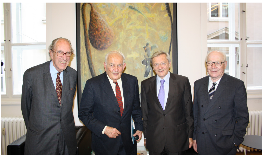
Prof. Grosser und Altbundeskanzler Schüssel mit den Ehrenpräsidenten der ÖGAVN Bot. i.R. Schallenberg (li) und BM a.D. Pahr (re)

Der Wert der Toleranz stünde seinem Ambivalent, und zwar dem der Intoleranz gegenüber. Doch seit wann sei die Toleranz ein europäischer Wert? So kritisiere Europa bzw. genauer gesagt, die katholische Kirche, wie intolerant der Islam sei und Menschen unterdrücke. Doch es sei nicht allzu lange her, dass die Kirche selbst als intoleranter Akteur agierte und ihre eigenen Werte und Interessen mit Gewalt durchsetzte. D.h., bevor man über andere urteile, müsse man die Fakten der eigenen Geschichte mit bedenken. Ebenso wurde der Wert der Religion thematisiert. Welchen ethischen Grundkern müssen alle Religionen besitzen, und ab wann dürfe eine Religion (unter unterschiedlichen kulturellen Einflüssen) „eigene“ ethische Werte vertreten? In Europa